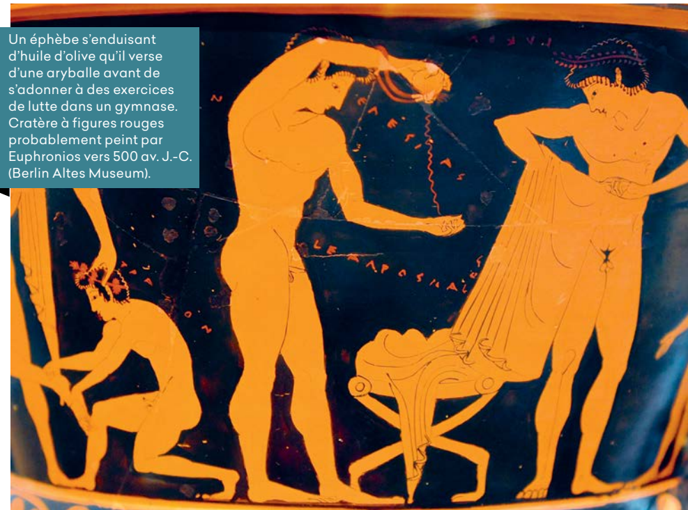
Un éphèbe s'enduisant d'huile d'olive qu'il verse d'une aryballe avant de s'adonner à des exercices de lutte dans un gymnase. Cratère à figures rouges probablement peint par Euphronios vers 500 av. J.-C. (Berlin Altes Museum).

L'avènement de l'Empire romain, à la suite de la victoire d'Octavien sur Antoine en 31 av. J.-C., et l'établissement d'une paix durable dans l'ensemble du bassin méditerranéen, entraîna une mutation. Si toutes les contrées bordières de la Méditerranée cultivaient l'olivier et si chaque région alimentait surtout sa population, certaines se spécialisèrent dans la production d'huile destinée principalement à l'approvisionnement de