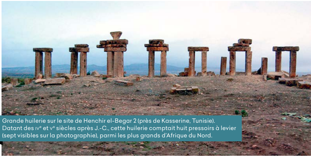
Grande huilerie sur le site de Henchir el-Begar 2 (près de Kasserine, Tunisie). Datant des IV e et V e siècles après J.-C., cette huilerie comptait huit pressoirs à levier (sept visibles sur la photographie), parmi les plus grands d'Afrique du Nord.

À partir du milieu du III e siècle de notre ère, des perturbations dues à des guerres et à des désordres économiques entraînèrent des réorientations: l'Espagne produisit moins et le relais fut pris par l'Afrique qui approvisionna dès lors Rome. Mais les malheurs du V e siècle (invasion de la Gaule puis de l'Espagne, prise de Rome en 410, dépopulation de la partie occidentale de l'Em-