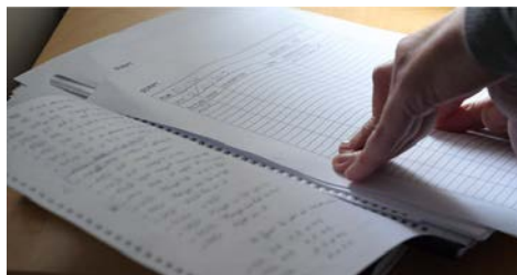
Le rapport de scripte aide le réalisateur et le monteur à effectuer plus rapidement le dérushage.

Le montage et l'étalonnage sont des techniques de postproduction cinématographique qui permettent de transformer des rushes en un ensemble narratif cohérent aux tonalités et aux couleurs uniformisées.