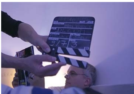
Le clap permet d'identifier les rushes . Ici il indique la 3 e prise du 7 e plan de la séquence 9.

Le dérushage n'est pas l'exclusivité des films de fiction. Dès l'instant où vous sélectionnez les plans à conserver et à éliminer, vous effectuez un dérushage.