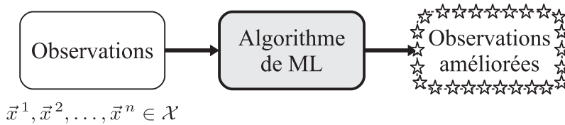
Figure 1.2 – Apprentissage non supervisé.

Dans le cadre de l'apprentissage non supervisé , les données ne sont pas étiquetées. Il s'agit alors de modéliser les observations pour mieux les comprendre (voir figure 1.2).