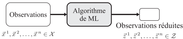
Figure 1.4 – Réduction de dimension.

La réduction de dimension est une autre famille importante de problèmes d'apprentissage non supervisé. Il s'agit de trouver une représentation des données dans un espace de dimension plus faible que celle de l'espace dans lequel elles sont représentées à l'origine (voir figure 1.4). Cela permet de réduire les temps de calcul et l'espace