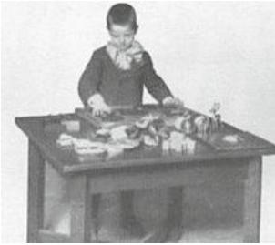
Enfant à la Psychological Clinic.

Quels sont les fondateurs de la psychologie clinique ?