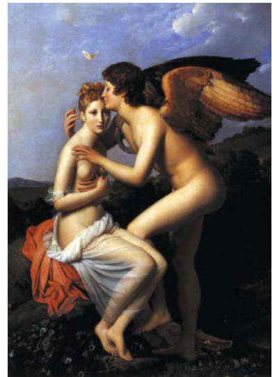
Psyché et l'Amour (François Gérard, 1798).

Le second temps dans la constitution d'une psychologie clinique est celle du XX e siècle, que nous aborderons plus amplement. C'est le temps où cette discipline va réellement se constituer en tant que telle, en reconnaissant l' individualité de chaque être humain, et la part de subjectivité de son activité psychique, mais d'une subjectivité appréhendable scientifiquement.