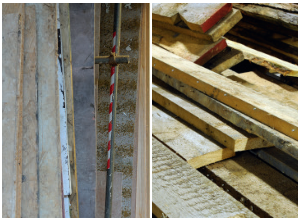
À GAUCHE En plus d'être bénéfiques pour l'environnement, les centres de revalorisation vendant du bois de récupération offrent une grande variété d'essences aux différents finis.

Une fois vos craintes dépassées, passez ensuite à la visite de chantier. Ce type de site regorge de matériaux bruts terminant directement à la benne. Ici encore, bonne figure rime avec bon augure. Sur les chantiers, des règles strictes concernant la santé et la sécurité s'appliquent. Il ne s'agit donc pas de se promener en touriste mais de solliciter l'attention d'un responsable en lui faisant part de votre projet et de vos besoins.