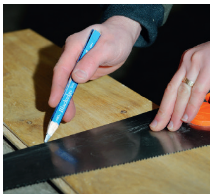
À GAUCHE Le dos de certaines scies égoïnes permet de marquer les angles à 45 et 90 degrés.

Lorsque l'on débute, le seul outil que je conseillerais d'acheter neuf pour l'équipement de base est la scie égoïne. S'il est fréquent d'en trouver dans les arsenaux de vieux outils, rares sont celles bien affûtées. Les dents des vieilles scies s'affûtent mais acquérir une telle compétence est de longue haleine. Les ouvrages à