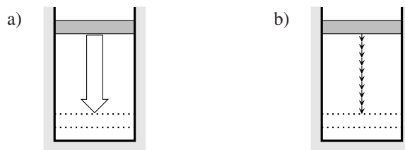
FIGURE 1.2 – Exemple de transformation (a) irréversible par modification brutale d'une contrainte extérieure et (b) réversible par modification quasi statique d'une contrainte extérieure

Soit un cylindre placé dans un champ de pesanteur, d'axe vertical et fermé par un piston mobile de masse m_0 , se déplaçant sans frottement (voir figure 1.2). Le cylindre contient un gaz parfait. Les parois du cylindre et le piston sont supposés athermanes (pas de transfert thermique).