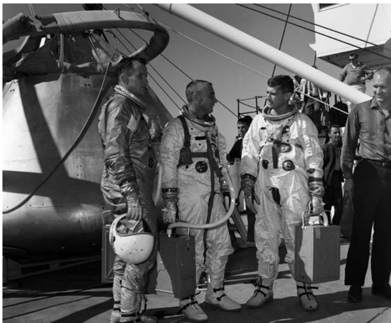
L'équipage d' Apollo 1 à l'entraînement : Ed White, Gus Grissom et Roger Chaffee (de gauche à droite).

Le premier test en vol de la cabine Apollo, plusieurs fois repoussé, était fixé à fin février 1967. Le 27 janvier, accouplé à une fusée Saturn IB sur le pas de tir de Cap Kennedy, le vaisseau est donc mis à l'épreuve d'une répétition générale, avec l'équipage à bord : le commandant Gus Grissom, Ed White et Roger Chaffee. Une opération de routine et sans risques, puisque les réservoirs de la fusée sont vides.